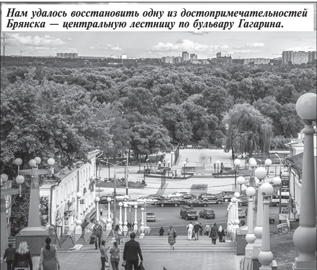
Нам удалось восстановить одну из достопримечательностей Брянска — центральную лестницу по бульвару Гагарина.

— Уверен, что Брянск продолжит оставаться современным и удобным для жизни городом, с развитой инфраструктурой, ухоженными улицами и скверами, счастливыми жителями и смеющимися детьми. А основными задачами в работе власти вижу повышение эффективности и конкурентоспособности экономики города, сохранение стабильности на рынке труда, развитие транспортной инфраструктуры, обеспечение бесперебойного функционирования объектов жилищно-коммунального хозяйства, поддержку социально незащищенных слоев населения, повышение качества и доступности муниципальных услуг, предоставляемых жителям города Брянска, сохранение природного богатства и разнообразия.