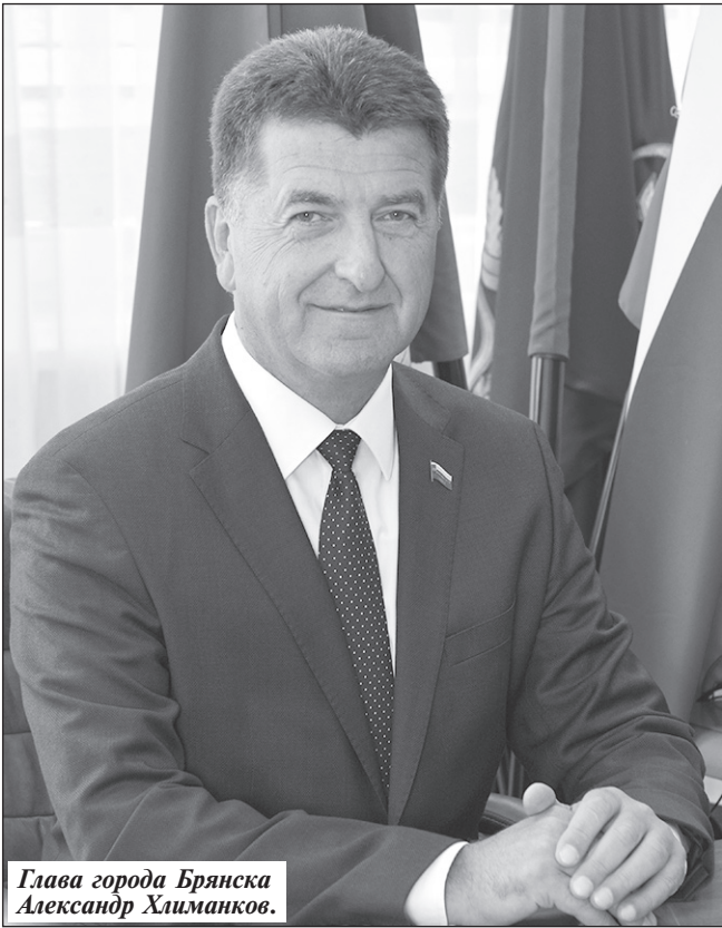
Глава города Брянска Александр Хлиманков.

— Наша работа строится на основе тесного взаимодействия с губернатором и правительством Брянской области, с исполнительной властью, с трудовыми коллективами предприятий и организаций. Совместная деятельность нацелена на реализацию основных направлений, определенных