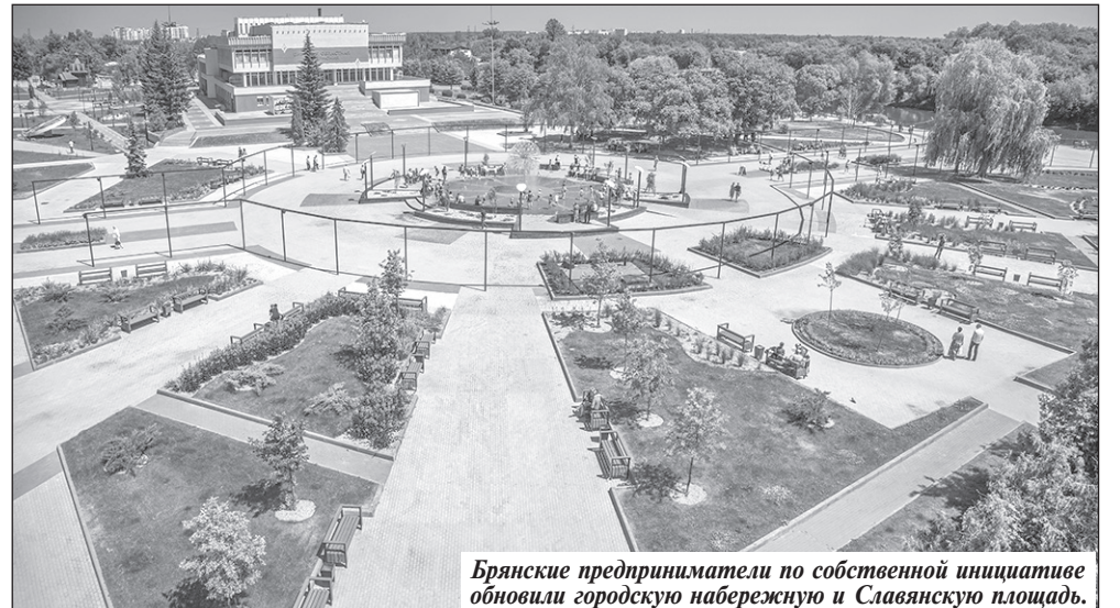
Брянские предприниматели по собственной инициативе обновили городскую набережную и Славянскую площадь.